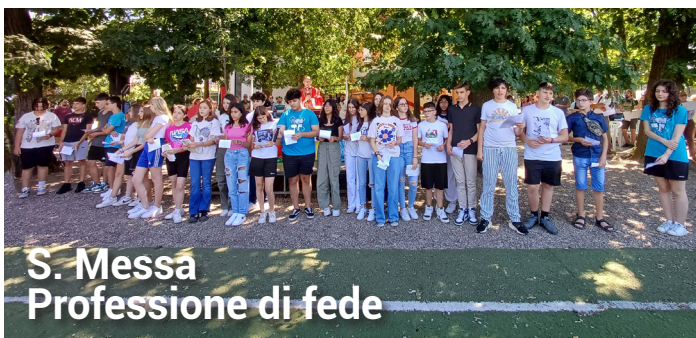
S. Messa Professione di fede